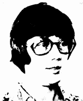
Skolminister Lena Hjelm-Wallén utfärdade strax före riksdagsvalet 1976 direktiv till en översyn av gymnasieskolan. Skolminister Göran Persson fick 1990 försöka åstadkomma en samlad proposition i ämnet.

SFL försökte under hela perioden, i linje med sin utbildningspolitik, driva på såväl översynen och reformeringen av gymnasieskolans innehåll, som dess utbyggnad, dessvärre utan större effekt. Det fanns stora hinder i vägen.